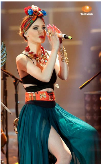
Belinda, cantante mexicana.

3. Mira las fotos de las mujeres mexicanas. ¿Hay influencia tradicional en la ropa moderna? Explicad las influencias/conexiones.